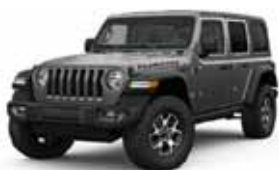
Granite Crystal PAU