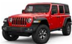
Firecracker Red PRC