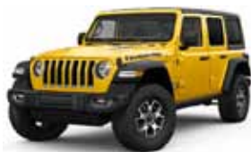
Helly Yella PYV