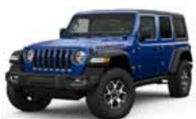
Ocean Blue PBM