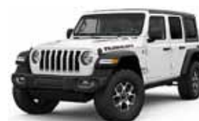
Bright White PW7